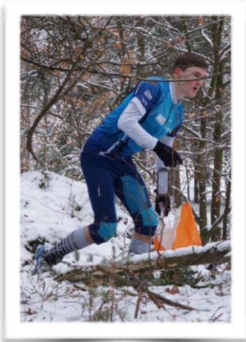
Christian ist Mitglied des Aargauer Nachwuchskaders.